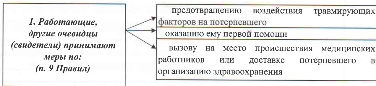
СХЕМА действий при несчастном случае (не приведшем к тяжелой производственной травме)