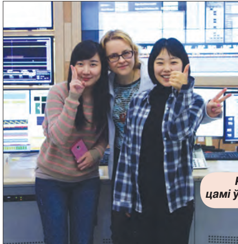
Разам з карэйскімі даследчыцамі ў лабараторыі сінхратрона PAL.

Карэйцы, як і японцы, вельмі любяць музыку, многія іграюць на розных інструментах. У машыне доктара Бэка, з якім мы праца-